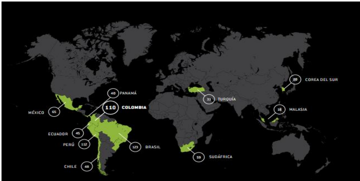
Ilustración 1 Desempeño Logístico: Infraestructura, Transporte y Logística

De acuerdo al último informe de competitividad en diferentes ramas y/o disciplinas brindado por el Consejo Nacional de Competitividad (CONPES, 2008), se evidencia la gran pérdida de participación que la República de Colombia ha ido sufriendo frente al contexto internacional logístico y de desarrollo en infraestructura relacionada con las transacciones internacionales, reflejadas en tiempos tales como (Importaciones y Exportaciones), ocupando el puesto 110 entre 140 países analizados (Siendo el número 1 el más tecnificado y en desarrollo logístico), lo cual ocupar dicho puesto es algo preocupante y en donde se sugiere tomar acciones en pro de la potencialización del factor comercial internacional con vista a lograr un mejor puesto en el ranking y por ende mejorar el nivel de la balanza comercial que actualmente tiene la nación.