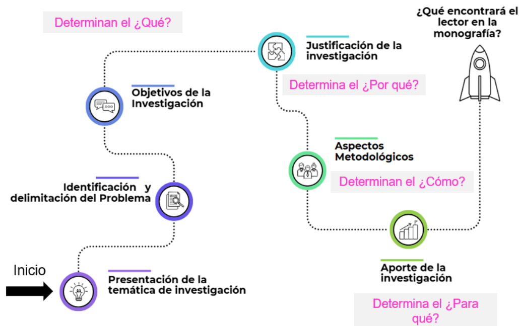
Figura 4. Estructura de la introducción en la monografía de investigación en los Programas a nivel de Especialización en la UDI.