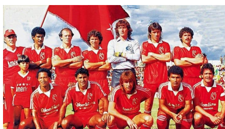
América de 1985

1985 es recordado como el año de las 16 horas de rock, cuando simultáneamente las ciudades de Londres y Filadelfia realizaron el 14 de julio el 'Live Aid', evento transmitido por televisión a 2.000 millones de espectadores, allí palpitó Queen con Radio Ga Ga ; también en la misma línea, 43 de las grandes figuras de la música de los Estados Unidos del momento se reunieron para cantar 'We are the world', la canción para África; asimismo en Norteamérica, se conoce en agosto el fallecimiento del actor Rock Hudson, cineasta de Hollywood que contrajo el Síndrome de Inmunodeficiencia Adquirida-SIDA; por otra parte, en septiembre un fuerte terremoto se presenta en México, dejando más de 8.000 muertos y 80.000 damnificados especialmente en la Ciudad de México; en Europa, hay cambios en el Kremlin, por parte del entonces canciller de la Unión Soviética durante 28 años Andrei Andreievich Gromiko quien pasó a gobernar su país.