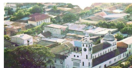
Armero

cuello: "Si me quedo dormida, no me dejen sola" y "Madre, si me escuchas, reza para que yo pueda caminar y esta gente me ayude".