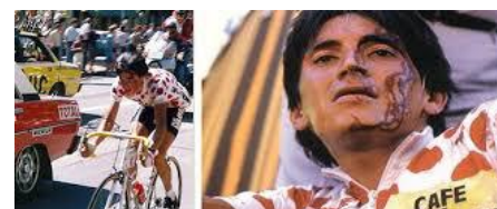
Lucho Herrera

Pero ocurrieron momentos épicos y de gloria por parte de nuestros deportistas a recordar en los anaqueles de 1985, como los triumfos del jardinerito de Fusagasugá Lucho Herrera en la etapa 11 en Morzine-Avoriaz, y la 14 en Saint-Étienne, donde una aparatosa caída lo llevó a cruzar la meta con el rostro ensangrentado en esa edición de La Grande Boucle.